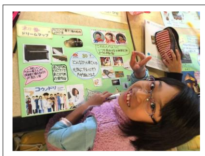
ドリームマップ完成！