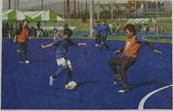
多世代のチーム同士でフットサルを楽しむ参加者たち

東広島市が昨年10月に新設した東広島運動公園フットサルコート（西条町田口）で8、9日、競技経験を問わず幅広い世代が参加できる初めての大会規模大会があった。県内外から計約400人が集い、試合やイベントを堪能。市は「県内の新たな競技拠点としてのPRにつなげたい」とする。大会は、アミューズメント施設など運営のパートナーグループ（広島市安佐南区）が主催。広島市内のコートが昨年末で運