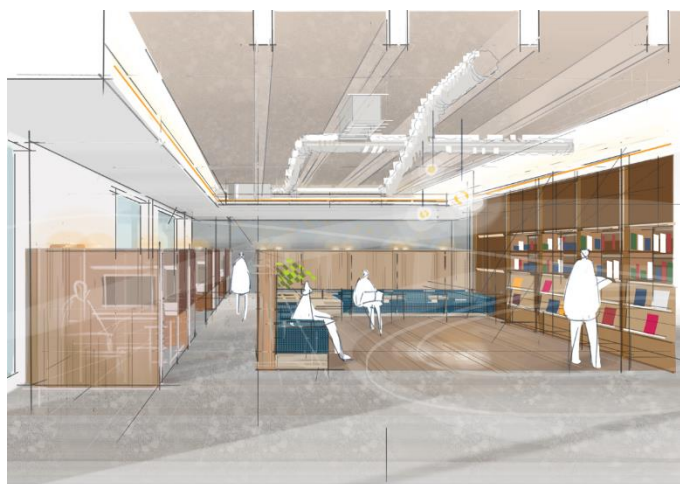
↑書斎ラウンジ(イメージパース)