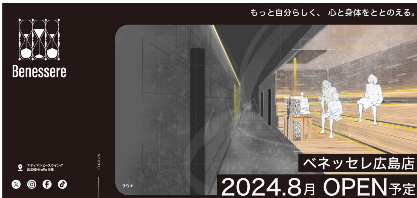
↑ティザーサイト TOP ページ・サウナ(イメージパース)