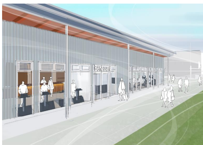
↑フィットネス・施設外観(イメージパース)