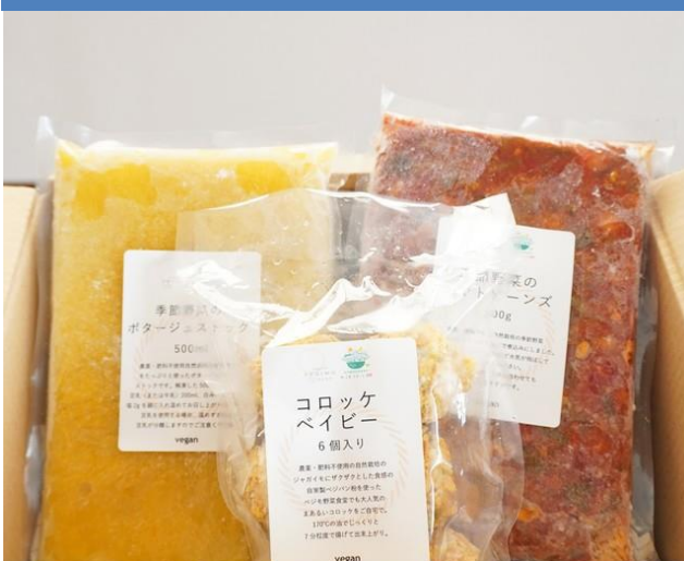
コロッケベイビー/節野菜のトマトビーンズ/ ポタージュストック【人参】